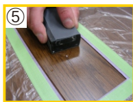
⑤ 表面の乾燥後、水を含ませたサンドペーパー(#400~800)で研磨して下さい。