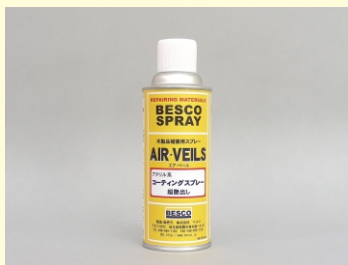
コーティングスプレー 超艶出し 300ml

コーティングスプレーは、アクリルラッカー系塗料を使用し、部分仕上用スプレーに比べ強く厚い塗膜で塗装が可能な設計になっています。光沢度が高いので鏡面仕上げに適しており、クリア層の厚い部材や広い面積の補修塗装にも最適です。