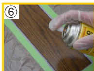
⑥ 平滑になったことを確認しラッカーズプレーもしくはアクリルスプレーで艶調整を行って下さい。