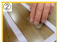
② キズを中心にサンドペーパーで目粗しして下さい。