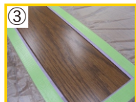
③ ウルトラリムーバーで汚れや油分を除去し、養生シートで養生して下さい。