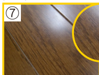
⑦ 乾燥したら完成です。