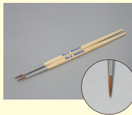
赤てん筆「細」NO. 2 (2本組)

充填前の傷口の処理に最適な三角刀。セット商品に付属するスタンダードタイプ。先端寸法1.5mm ※三角刀は細い線や鋭い線を彫ることができます。