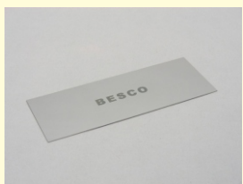
スペシャルスクレーパー L

やや大きな面積の彫り込みに便利な丸刀。先端寸法3mm ※丸型は、三角刀に比べ、浅く広く彫ることができます。