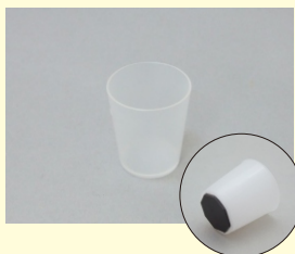
マグネット付カップ

スコッチ面で目荒らし、フェルト面でバフがけ、コットンを巻きキッドサンドペーパーJを含ませて充填の除去と多目的に使える便利ツール。