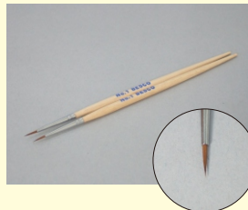
赤てん筆「極細」NO. 1 (2本組)

やや大きなキズのキズ口整形や彫り込み、前処理に便利な「大」サイズの三角刀。先端寸法3mm ※三角刀は細い線や鋭い線を彫ることができます。