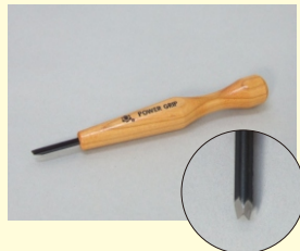
パワーグリップ(三角刀)「大」

カラーパレット等で着色する際に使用する筆。セット商品に付属しているサイズです。耐溶剤性にも優れた専用の細筆です。