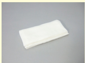
コットンセット(10枚入り)

充填し周辺にはみ出した余分なワックスの除去等に使用する、スチールウール。(粒度:#000 極細)