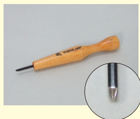
パワーグリップ(丸型)「大」

筆先に腰をもたせ、繊細な木目が描けるように仕立てた、ベスコオリジナル補修筆。筆先は赤てん筆No.1とNo.2の中間位程度の細さです。