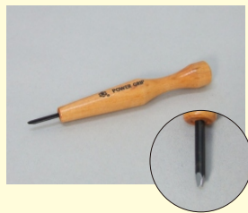
パワーグリップ(三角刀)「小」

充填前の傷口の処理に最適な三角刀。セット商品に付属するスタンダードタイプ。先端寸法1.5mm ※三角刀は細い線や鋭い線を彫ることができます。