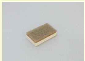
フェルトブロック

カラーパレット等による着色の際に、NCソルベントJなどの希釈剤を入れるミニカップ。