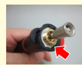
フィルターは本体とこて先を取り付ける溝部に付いています。